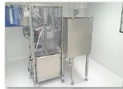
Llenadora de sueros