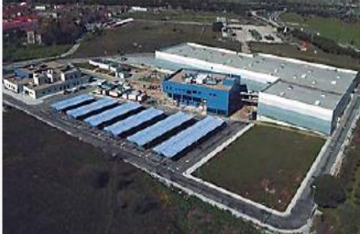
Vista aérea del centro

El Centro Militar de Farmacia de la Defensa, ubicado en la Base Militar de San Pedro en Colmenar Viejo, tiene como principal misión la producción de los elaborados destinados a las Fuerzas Armadas bajo las Normas de Correcta Fabricación 1 . El Módulo de Estériles de la Unidad de Producción cuenta con distintos equipos, algunos de nueva adquisición y otros trasladados desde el Centro Militar de Farmacia de Córdoba, para la fabricación de los elaborados estériles recogidos en el Petitorio de Farmacia 2 .