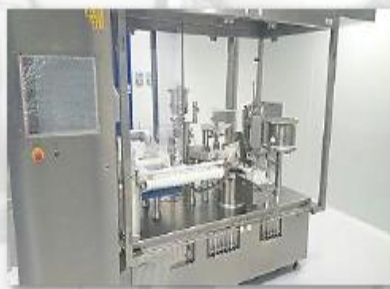
Nueva llenadora de ampollas