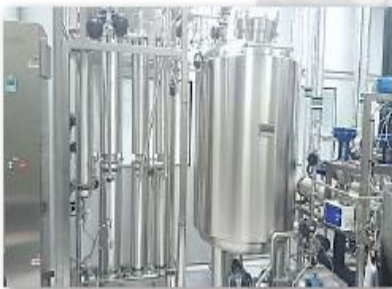
Destilador de agua para inyectables

Análisis de las líneas de fabricación existentes en el Módulo de Estériles. Revisión de las características técnicas de cada uno de los equipos y de las instalaciones.