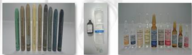
Elaborados y presentaciones 2